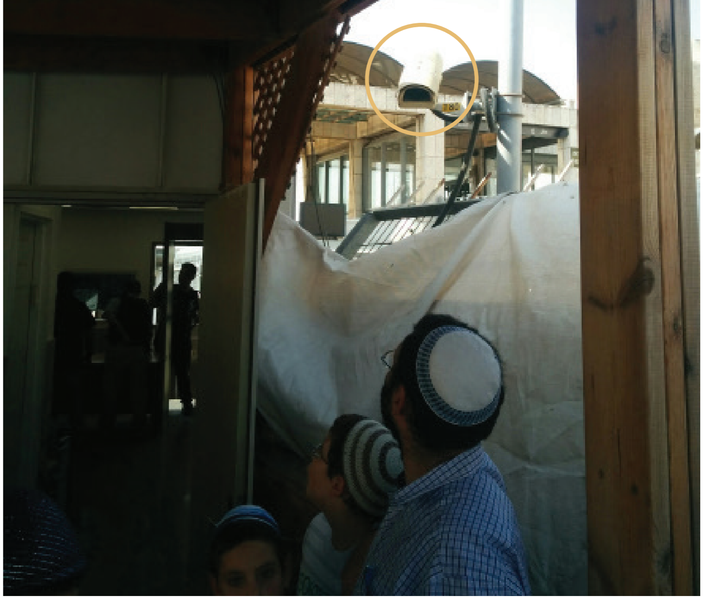
הגלאים לא חוסרו בשער הכניסה ליהודים. מנגנומטרים ומצלמות בשער הלא (המוגרבים)